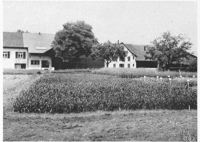
Abb. 2. Lehrgut Rossberg, Roggen-Getreide Zuchtfield

Mit der Uebernahme der Dozentur für Tierproduktionslehre an der Abteilung für Landwirtschaft der E. T. H. im Sommer 1929 durch den gegenwärtigen Ordinarius fand gleichzeitig eine Ergänzung der bisherigen mehr empirisch-praktischen Lehrinstellung nach der wissenschaftlich-experimentellen Seite hin statt. Diese Umstellung setzte zunächst die Schaffung gewisser Forschungsmöglichkeiten voraus. Das Fehlen eines neuzeitlich ausgestatteten wissenschaftlich-technischen Tierzuchtinstitutes stand zu der rasch vorwärtsschreitenden und hochstehenden schweizerischen Züchtungspraxis in einem bemerkenswerten Gegensatz. In einem ausgesprochenen Züchterlande, wie die Schweiz es ist, wo die Züchtung zusehends immer mehr zur qualifizierten Präzisionsarbeit wurde, musste ein solcher Mangel auf die Dauer für Wissenschaft und Praxis nachteilig in Erscheinung treten. Als angewandte Wissenschaft besitzt die Züchtungslehre der Haustiere im Gegensatz zu den reinen Wissenschaften in hohem Masse einen nationalen Charakter, weshalb gerade diese Disziplin ohne den Unterbau einer bodenständigen landeseigenen Forschung ihren Zweck mit der Zeit nicht mehr hätte erfüllen können. — Die tatkräftige Unterstützung des derzeitigen Präsidenten des Schweizerischen Schulrates ermöglichte die Einrichtung eines provisorischen Tierzuchtinstitutes an der E. T. H. Zürich im Jahre 1930. Im Kellergeschoss des Nordwestflügels des land- und forstwirtschaftlichen Gebäudes wurden zunächst vier kleinere Räume proviso-