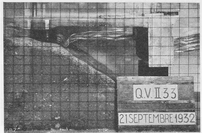
Fig. 17. Modèle à l'échelle 1 : 30 du nouveau quai de Vevey. Vue prise à l'instant où le creux d'une vague atteint la caisse-écran (houle incidente : \lambda = 25 m, h = 1,50 m).

Zur Deckung eines Gesamtwärmebedarfs von 954\,000 \text{ Cal/h} sind 4 Strebelkessel mit je 34 \text{ m}^2 Heizfläche für den Winterbetrieb und ein fünfter Kessel mit 15,5 \text{ m}^2 für den Sommerbetrieb vorhanden. Von einem Dampfverteiler gehen zunächst die Leitungen zur Heizung aller Gemeinschafts- und Nebenräume ab, die