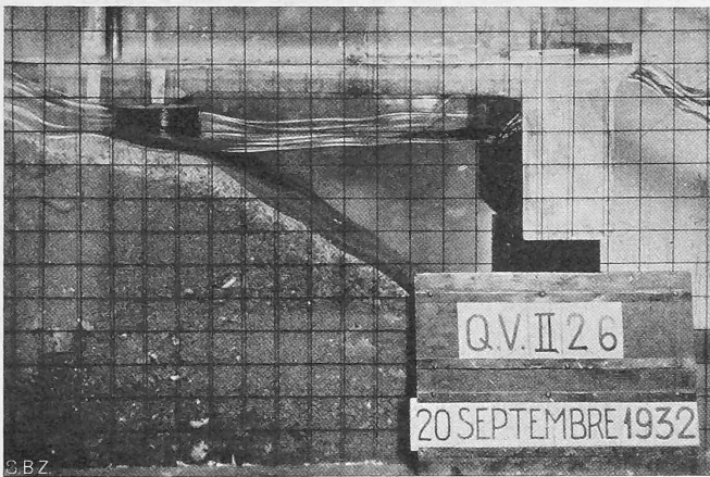
Fig. 16. Modèle à l'échelle 1 : 30 du nouveau quai de Vevey. Vue prise au moment où la crête d'une vague arrive sur la caisse-écran (houle incidente : \lambda = 25 m, h = 1,50 m).

Les Fig. 16 et 17 se rapportent au modèle du nouveau quai de Vevey, dont l'étude a été faite à l'échelle 1 : 30. A la Fig. 16, le quai subit l'assaut de la crête d'une vague, tandis qu'à la Fig. 17, la caisse-écran, destinée à protéger le talus naturel contre les vagues, est atteinte par un creux. La méthode utilisée pour la mesure de la sollicitation du quai consistait à enregistrer les petits déplacements du modèle, suspendu élastiquement. Cette méthode a été décrite en janvier 1933 dans la revue «Schweiz. Bauzeitung» (vol. 101, pag. 29, 48).