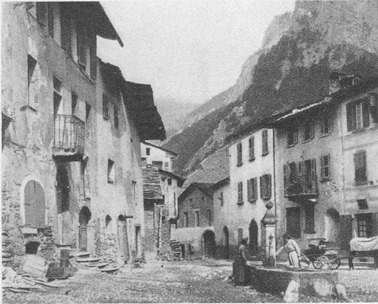
Der Dorfplatz von Sembrancher.