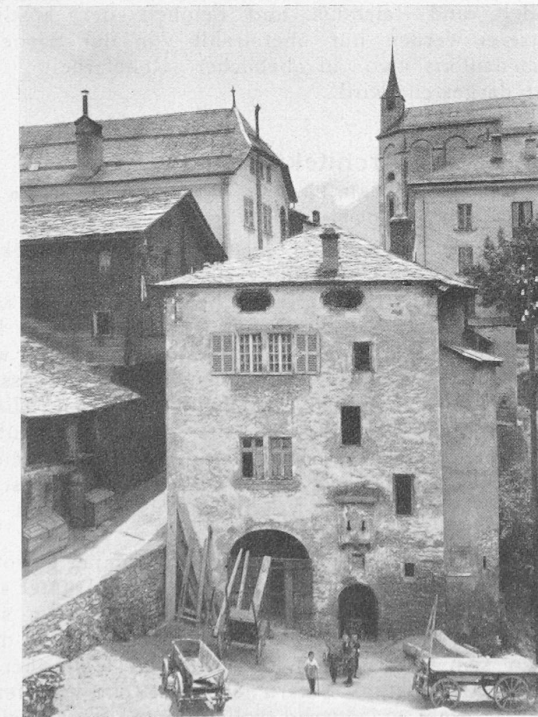
Das ehemalige Hospital von Visp.

Kämpfer und Kaufleute die Bauherren. Zwar ist im Vorwort des Bandes vermerkt, das Wallis habe wenig Eigenes in seiner Baukunst, die hauptsächlich italienische Züge trage. Und doch geht durch die Bauten dieses Landes ein so typischer gemeinsamer Zug, dass er keineswegs übersehen werden kann: es ist das Starke, im Kampf Erprobte, das durch die Not des Alltags ernst und einfach Geformte, ob es sich um Holz- oder Massivbau handle. Die mit Landschaftsgemälden tapezierten Zimmer reicherer Stadthäuser, oder etwa das zierliche Haus Pancrace de Courten in Sierre