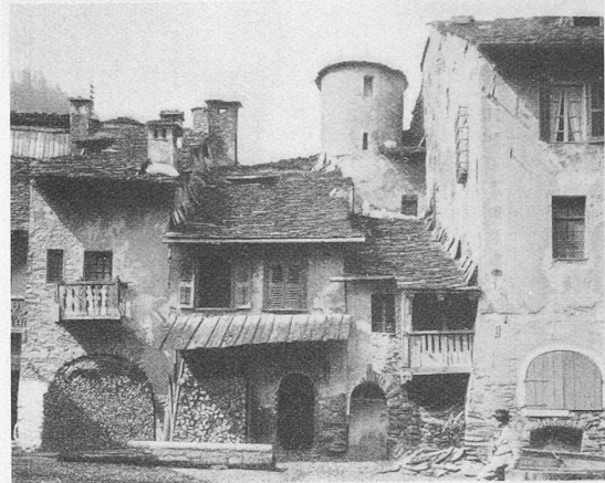
Haus Ribordy in Sembrancher.