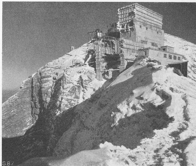
Die Schwebebahnstation auf dem Säntisgipfel (Bauzustand zu Ende 1934).

Vom Stand der Bauarbeiten der Säntis-Schwebebahn (vergl. Bd. 103, S. 210*) wird uns, im Nachgang unserer Mitteilung in letzter Nummer, von der Bauleitung folgendes berichtet. Die Zufahrtstrassen von Urnäsch her sind im Rohbau fertig, auf der unteren Teilstrecke bis zur sog. Steinfluh verkehren bereits fahrplanmässig die Postautos. Die untere Station der Schwebebahn und ihre Wasserversorgung auf der Schwägalp sind vollendet, das dortige Bahnrestaurant ist bereits eröffnet. Die Kraftleitungen Urnäsch-Schwägalp und Schwägalp-Säntisgipfel sind erstellt und in Betrieb. Von der Bergstation am Säntisgipfel ist das Maschinenhaus im Rohbau vollendet (Abb. oben) und von Monteuren bewohnt, die auch im Winter an der Montage der maschinellen und elektrischen Ausrüstung der Luftseilbahn arbeiten. Die Montageseilbahn zum Berggipfel, die schon im vorigen Frühjahr erstellt wurde, ist in der Abb. links neben der Bergstation zu sehen. Die beiden Kabinen der Säntis-Schwebebahn hat die Industriegesellschaft Neuhausen hergestellt; jede Kabine fasst 35 Personen.