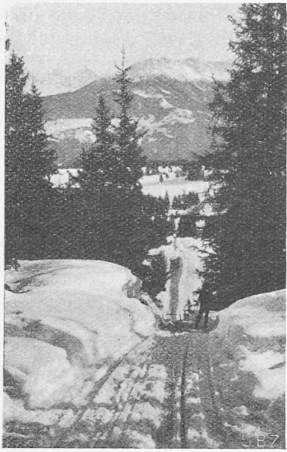
Abb. 2. Tiefblick auf die Bahn.