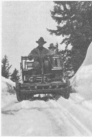
Abb. 3. Talfahrt mit Handbremse.

Das Zugseil bedarf keiner besondern Stützung; es gleitet auf dem Schnee, mit Ausnahme bei den Gefällsbrüchen, wo einfache Holztraversen eingebaut werden. Die Winde ist direkt mit dem Elektromotor gekuppelt und besitzt ausser der elektrischen Bremse, die bei Stromunterbruch automatisch in Tätigkeit tritt, eine doppelte Hand-Bandbremse, die auf den Umfang der Seiltrommel wirkt. Der Motor ist für eine Geschwindigkeit des Schlittens von 1,5 m/sec untersetzt; bei der Talfahrt kann man den Motor auskuppeln und den Schlitten mit 2,5 bis 3 m/sec hinuntergleiten lassen, wobei die Geschwindigkeit durch die Bandbremse geregelt wird. Der Schlitten ist mit einer handbetätigten Kratzerbremse (Abb. 3) und einem bei Zugseilbruch automatisch wirkenden Arretiersporn ausgerüstet, der allerdings nur bei der Bergfahrt wirkt; bei der Talfahrt muss er abgehoben werden. Nachdem aber die Förderung fast ausschliesslich bergwärts benützt wird, kann das Fehlen einer automatischen Bremse bei der Talfahrt unbedenklich in Kauf genommen werden.