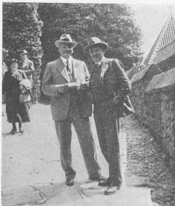
Alt Fry Rhaetier auf Hohkönigsburg.

Hinter dem Motor wird man heiss und schläfrig, der Wagen klimmt empor zum Col du Linge, ehemals heiss umstrittenes Kampfgebiet. Die Spuren davon sind stark getilgt, doch ernst genug