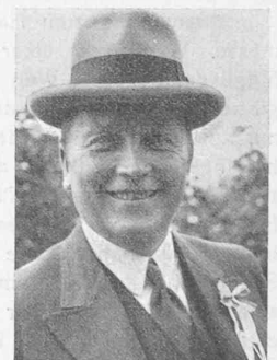
Der Herr Präsident.

Dieser Tag hat keinen Höhepunkt, sondern eine Höhenlinie: die Route des Crêtes. Es war ein herrliches Erlebnis, so an die drei Stunden lang wie auf dem Dachfirst der Welt dahinzurollen, links hinunter, rechts hinunter zu schauen auf Täler, silberne Flüsse, Dörfer, über immer neue Berge und Hügel ins fern verschimmernde Land hinaus. Immerfort zu fahren, fahren, fahren — ganz berauscht von Welt, Himmel, Sonne, Luft. Die Erscheinung des Herrn Präsidenten, den wir bei der Rast auf dem Ballon de Guebwiller antreffen, ruft uns aus unserm Höhenrausch zurück in die Welt der Beziehungen, der Disziplin, des Strebens und Handelns. Soweit ins Unterbewusste reicht noch heute, ein Dezennium nachdem wir von seiner Tafel nachgeschrieben, die Macht der Persönlichkeit!