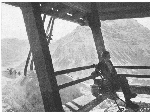
Abb. 18. Blick aus der Laube südwestlich auf Vorderglärnisch.