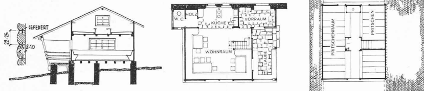
Abb. 14 bis 16. Schnitt und Grundrisse Elmerberg. — 1 : 300.