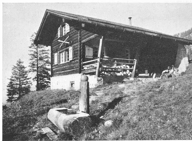
Abb. 17. Skihütte Elmerberg des Skiklub Glarus.