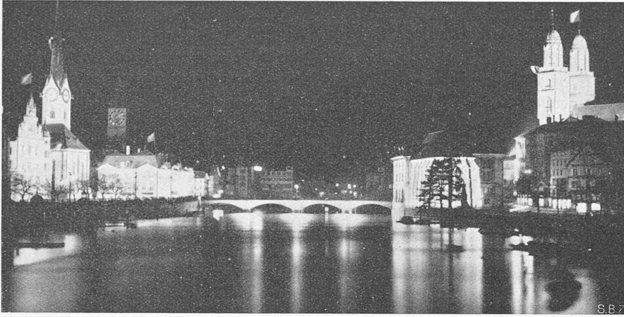
Abb. 1. Unkünstlerische, weil übertrieben starke Anleuchtung in Zürich.