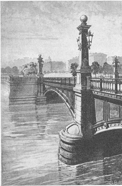
Abb. 2. Pfeiler-Dekoration gemäss dem Konkurrenzprojekt von 1882. (Die Bildtiefe ist perspektivisch übertrieben.)

Offizieren, anderseits das Gebiet der Luxus-Sportschiffe. In einer Zahlentafel werden etwa 30 heute im Dienst stehende Schulschiffe verschiedener Nationen durch ihre Hauptdaten gekennzeichnet, an der Spitze die jüngst in einer Fallbö gekenterte deutsche „Niobe“; es handelt sich um Schiffe von 150 bis 3000 t, von denen etwa die Hälfte vor 1901 gebaut wurde und in der Regel ohne Hilfsantrieb ist, während die übrigen, unter denen sich italienische und japanische Schiffe aus dem Jahre 1930 befinden, Hilfsmotoren antriebe aufweisen. Unter den in jüngster Zeit gebauten Sport-Grosssegeln wird die 1931 von der Germaniawerft