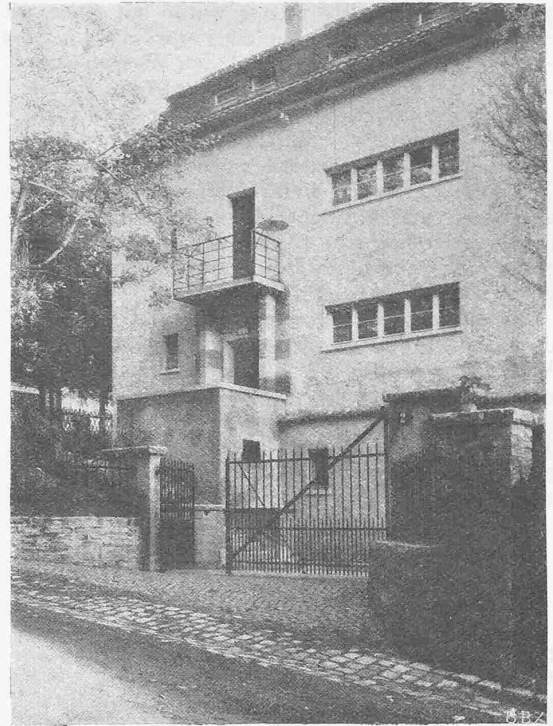
Abb. 3. Einfahrt und Eingang Tobelhofstrasse.