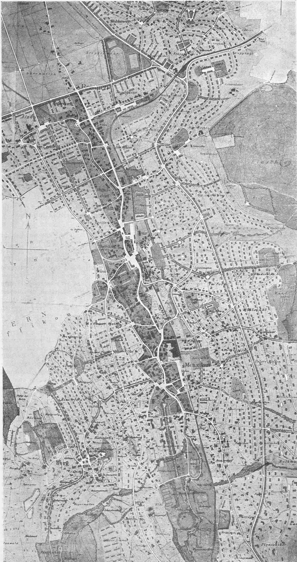
3. Rang ex aequo (1800 Fr.), Entwurf Nr. 18. — Alb. Bodmer, Ing., Winterthur, Mitarbeiter Rud. Säuberli, Geometer, Reinach. — Gesamtplan der drei Gemeinden Reinach, Menziken und Burg. — Masstab 1 : 15000.

Da kein Projekt in allen Teilen einwandfreie Lösungen bietet, wurde von der Erteilung eines ersten Preises abgesehen. Die