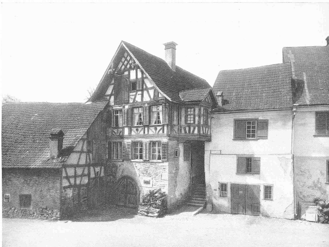
RIEGELHAUS BEI DER ALTEN MÜHLE IN STECKBORN