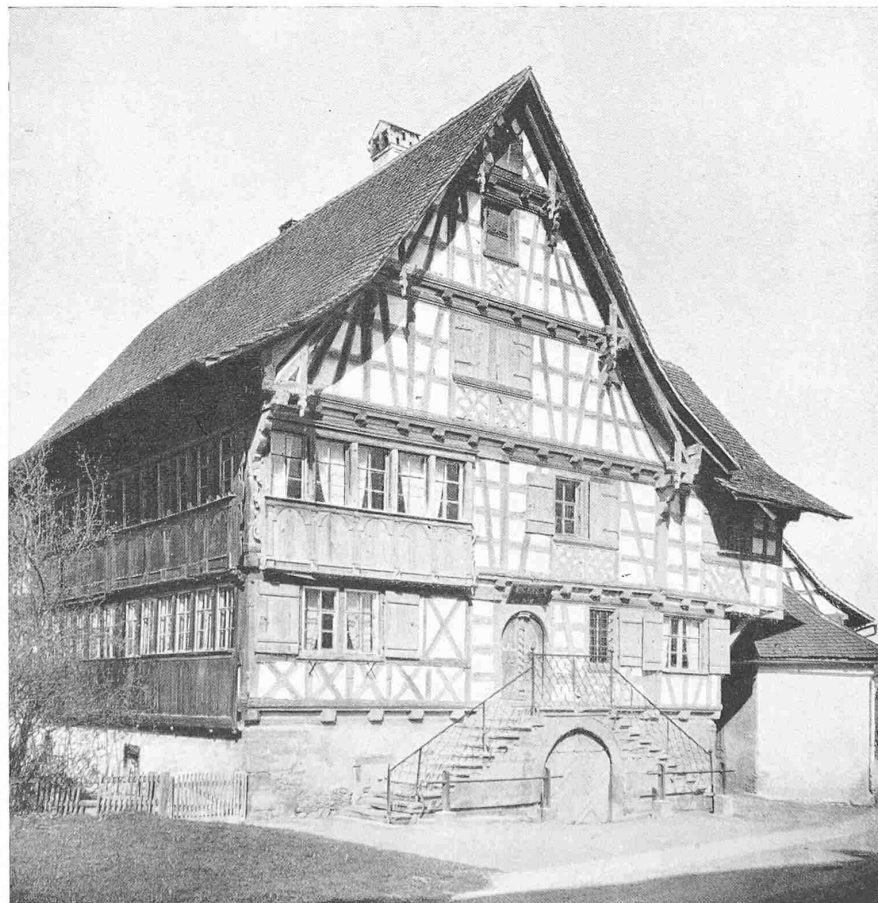
OBEN : „DRACHENBURG“ IN GOTTLIEBEN