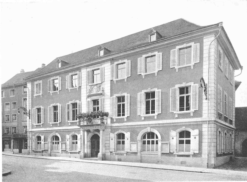
RATHAUS IN FRAUENFELD