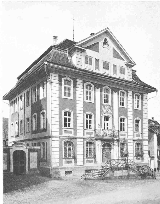
RATHAUS IN BISCHOFSZELL