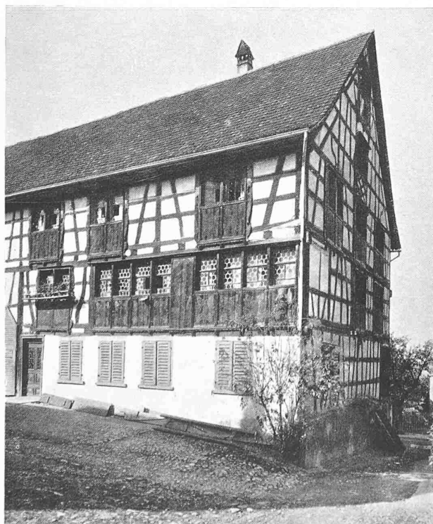
RECHTS: KEHLHOF IN BERLINGEN