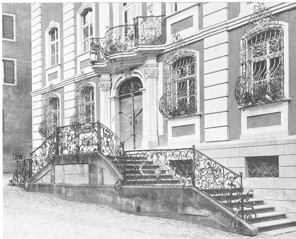
TREPPENAUFANG ZUM RATHAUS BISCHOF SZELL