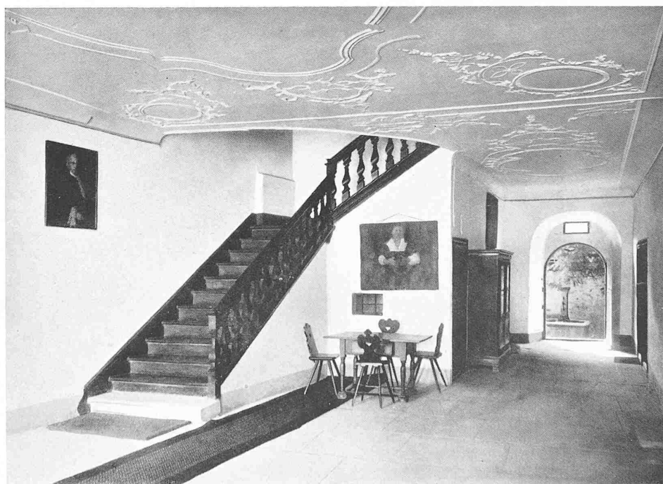
ERDGESCHOSS-HALLE IM „ROSENSTOCK“, BISCHOF SZELL

DAS BÜRGERHAUS IN DER SCHWEIZ, BAND XIX, KANTON THURGAU HERAUSGEGEBEN VOM SCHWEIZERISCHEN INGENIEUR- UND ARCHITEKTEN-VEREIN VERLAG ART. INSTITUT ORELL FÜSSLI, ZÜRICH