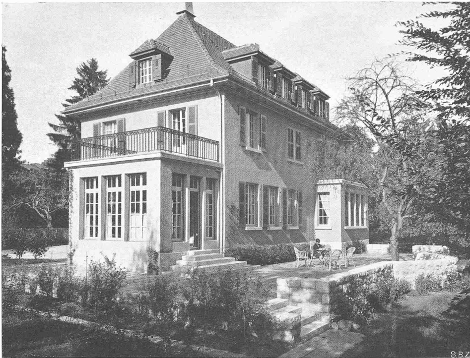
VILLA AU PETIT-SACONNEX PRÈS GENÈVE ARCH. JEAN STENGELIN, FRONTENEX-GENÈVE