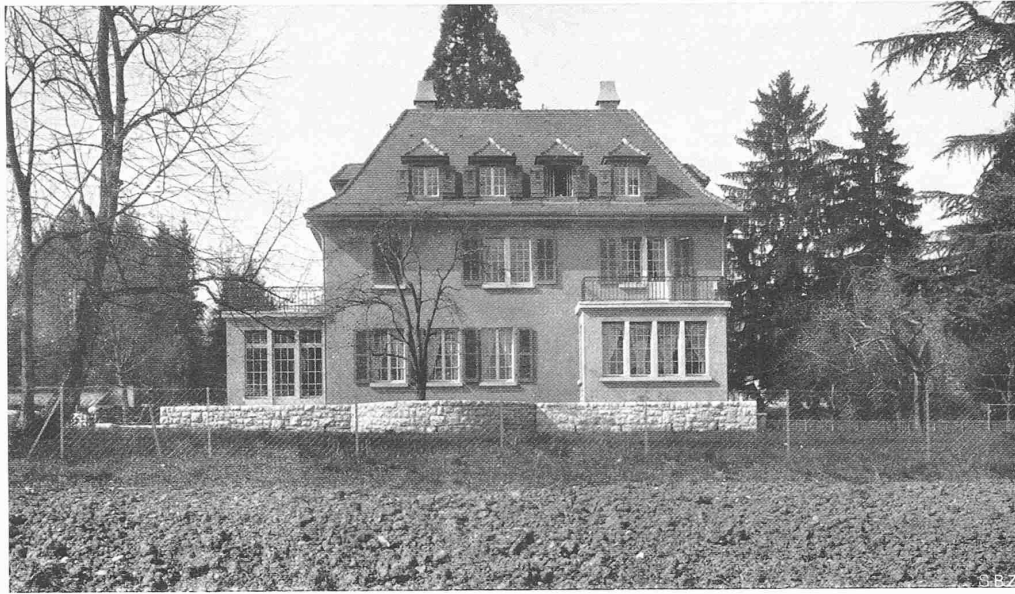
VILLA AU CHEMIN PASTEUR, PETIT-SACONNEX PRÈS GENÈVE ARCH. JEAN STENGELIN, FRONTENEX-GENÈVE