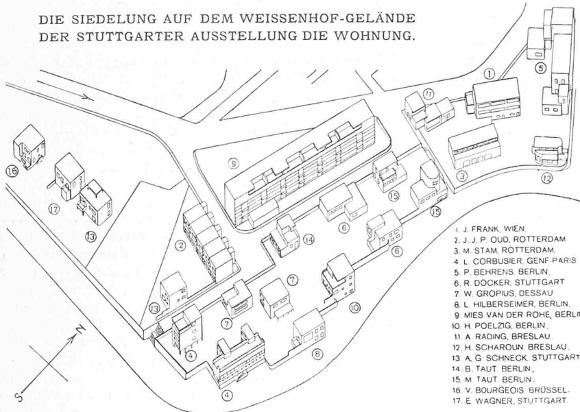
Axonometrie-Masstab etwa 1 : 2000, nach „Stein, Holz, Eisen“ 2. Sondernummer „Die Wohnung“. — Der Zugang erfolgt von der westl. Ecke, der Endschleife der Strassenbahnlinie 10, die mit rund 4 km Länge vom Hauptbahnhof über die Birkenwaldstrasse das Weissenhof-Gelände erreicht.

lich interessant, und somit vorzüglich (denn bei einer Ausstellung kommt einzig dieser Gesichtspunkt in Betracht). Als Siedlung betrachtet wird sie den guten Gedanken der modernen Architektur viel mehr schaden als nützen, weil sie ihnen, den vorübergehenden, ausstellungstechnischen Rücksichten zuliebe, aufs Schrofste widerspricht; der Besucher, der in ein paar Jahren dieses verworrene Filmdorf betrachten wird, ohne zu wissen, dass er die „stehengebliebenen Reste eines ehemaligen Ausstellungsparkes“ vor sich hat, wird sich an den Kopf greifen und wohl schwerlich mildere Gefühle dafür aufbringen, als für die berühmte Künstlerkolonie auf der Mathildenhöhe in Darmstadt 1) .