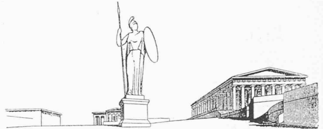
Abb. 54 und 55 Athen / Ansicht und Grundriss der Akropolis. Die unregelmäßige Anordnung war bedingt durch alte Lokalkulte, also nicht durch künstlerische Absichten. Das gewaltige Standbild der Athene sollte als Gegengewicht gegen das Parthenon die Asymmetrie etwas ausgleichen.

Restbeständen „alter Lokal-Kulte“ richten müssen. Für die unser räumliches Empfinden am schroffsten verletzende Aufstellung der Promachos und für die Anlage des Serpentinweges fehlt aber dieser Annahme jede Grundlage, und auch die nicht axiale, und auf den Platz dennoch merkwürdig wenig Rücksicht nehmende breite Treppe vor dem Parthenonwestgiebel wird von dieser Erklärung nicht berührt. Pedanterie ist wohl das Letzte, was man den Griechen vorwerfen kann, und so darf die gegenteilige Annahme mindestens gleichviel Wahrscheinlichkeit beanspruchen, nämlich die, dass ein wirklich starkes Raum- und Axen-