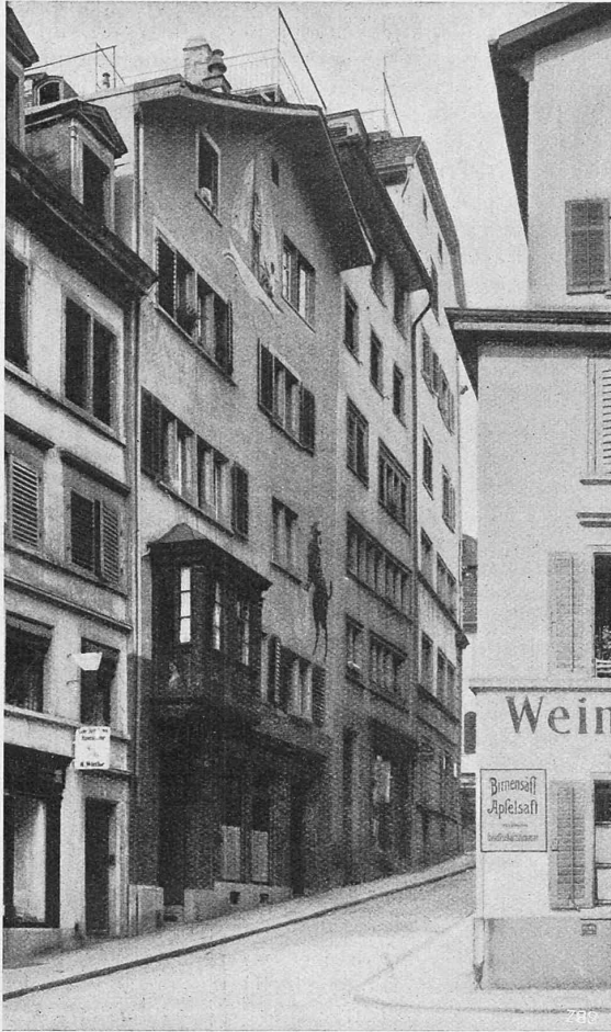
Abb. 4. „Zum Widder“, Widdergasse, Kunstmaler Karl Hügin.