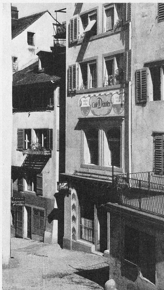
Abb. 3. Café Dézalcy, Römergasse, von With. Hartung.

Effekte dürften nicht in der gleichen Strasse sein. 1) Ein Erker ist eine Art Möbel, eine Kuriosität, ein Stück Innenraum, der vor Neugier die Fassade sprengt; schon plastisch ist er meist sehr reich behandelt, und so will seine Ungewöhnlichkeit auch noch farbig betont sein. Das starke Rot ist hier also durchaus am Platz, nur sollte zur weiteren Gliederung noch eine oder die andere Farbe dazukommen, etwa weiss, gelb, gold, dunkelbraun, schwarz. Die mehr als harmlosen Malereien der Füllungen sehen aus wie Abziehbildchen, sie reden farbig nicht mit. Der plastisch einfachere, und unnötig dunkle Erker gegenüber wirkt schon durch seine wenigen Rahmungen feiner (Abb. 4).