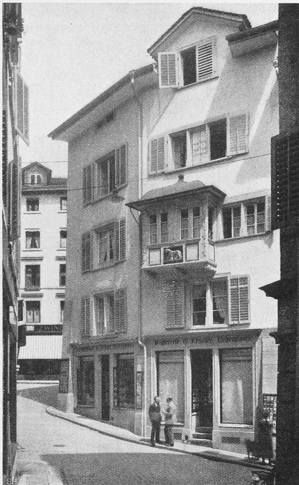
Abb. 6. „Zum grossen Leopard“, Strehlgasse Nr. 14, der Erker.