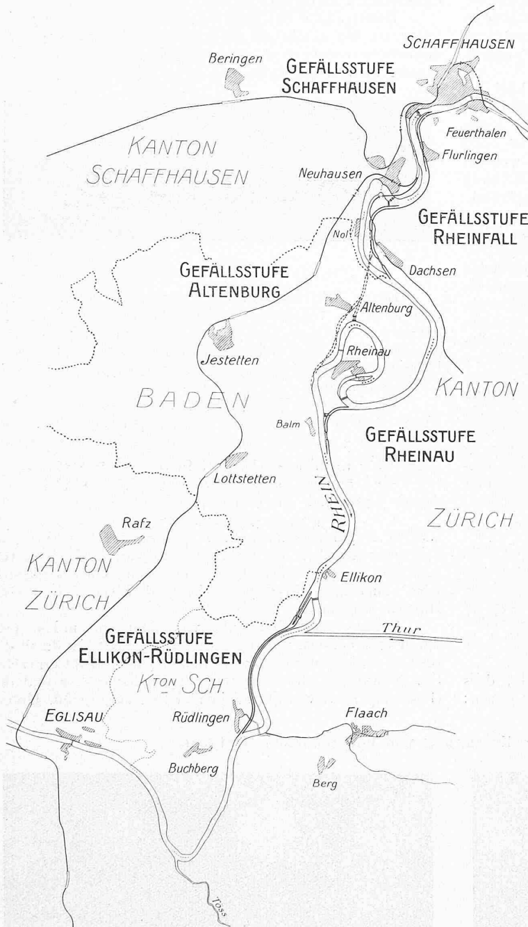
Abb. 1. Uebersichtsskizze der Strecke Eglisau-Schaffhausen. — Masstab 1 : 100 000.

Breite des Kanalquerschnittes in Tiefe des Bodens eines vollbeladenen 1200 t-Kahnes, also 2,20 m verstanden ist; Wassertiefe im Oberwasser 3,5 bis 4,0 m entsprechend der Oberdempeltiefe; Wassertiefe im Unterwasser 2,5 m bzw. 3,0 m entsprechend der Unterdempeltiefe; kleinster Krümmungshalbmesser R = 400,0 m; in Krümmungen ist die Sohle entsprechend den örtlichen Verhältnissen und den Schiffsabmessungen zu verbreitern. b) Für dreischiffigen Betrieb: Die Vorhäfen erhalten eine Sohlenbreite von 42,0 m.