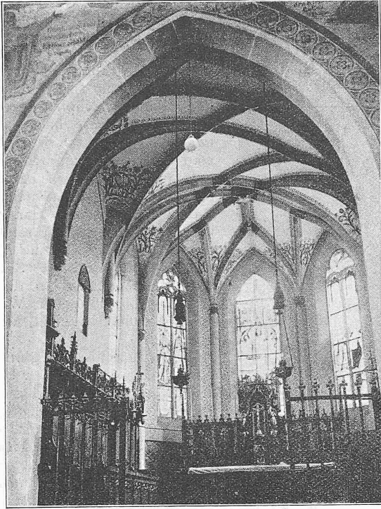
Meister Hans Felder: St. Oswald in Zug.