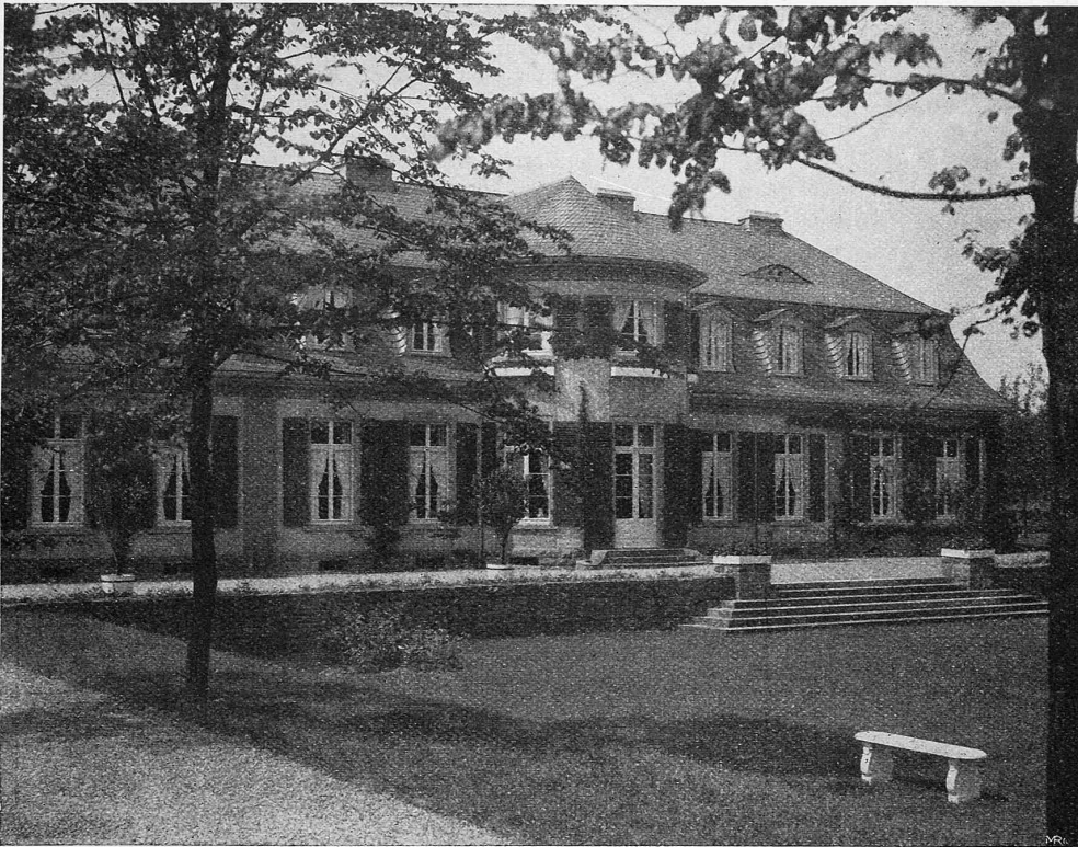
Abb. 1. Landhaus B. bei Hackhausen. Architekt Prof. Paul Schulze-Naumburg. Aus „Deutsche Kunst und Dekoration“. Verlag von Alexander Koch, Darmstadt (siehe unter Literatur).