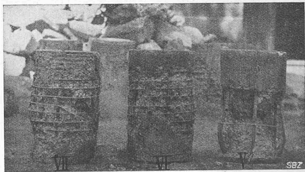
Abb. 5b. Versuchskörper V, VI und VII.

Festigkeit erhöhende Wirkung der Umschnürung setzt, wie dies bei allen wissenschaftlichen Versuchen nachgewiesen