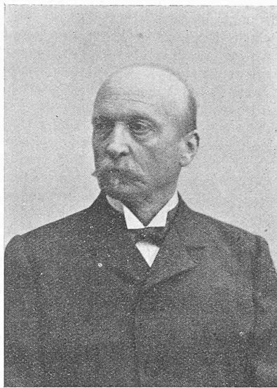
Oberst Ed. Rubin

fabrik aus kleinen Anfängen in einen grossen Betrieb mit musterhafter Ordnung entwickelt und sind beständig neue und grössere Anforderungen an die Herstellung der Munition gestellt worden, infolge der Veränderungen in den Waffenkonstruktionen. Seine maschinen-technischen Kenntnisse und darauf gegründete reiche Erfahrung ermöglichten es ihm, stetsfort die maschinelle Ausstattung der Munitionsfabrik den wechselnden Bedürfnissen der Fabrikation in allen Einzelheiten anzupassen, um unser ganzes Schiesswesen auf der Höhe zu halten. Besonders haben, auch ausserhalb unseres Landes, seine Erfolge bei der Einführung des kleinen Kalibers volle Anerkennung gefunden. Auf die Einzelheiten seiner Leistungen auf diesem Gebiete einzutreten, ist nicht unsere Sache; es genüge uns, daraus den Schluss zu ziehen, dass mit Rubins Heimgang ein ganzer Mann aus unsern Reihen geschieden ist.