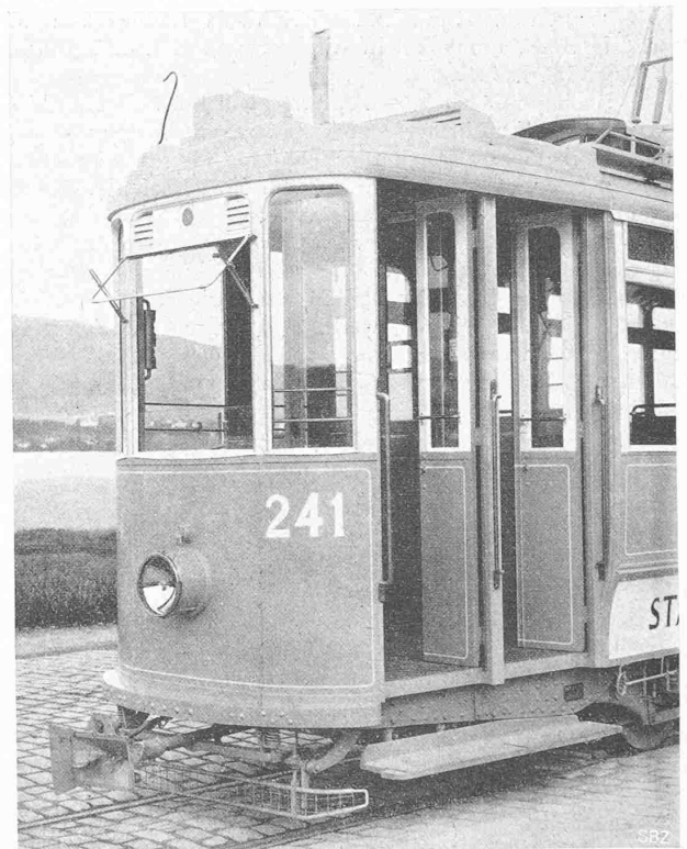
Abb. 6. Hinteres Motorwagen-Ende, Ein- und Ausstieg-Türen.