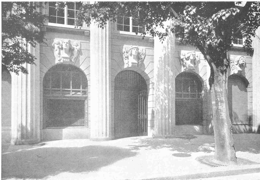
OBEN FASSADE 1 : 250