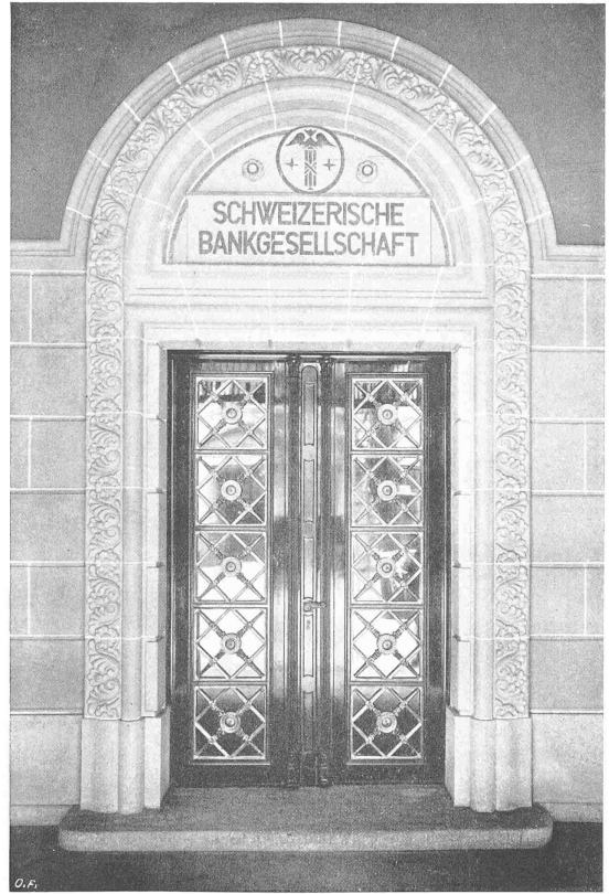
HAUPTINGANG DES BANKGEBÄUDES ZUM MÜNZHOF IN ZÜRICH