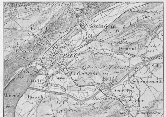
Abb. 1. Uebersichtskarte von Bözingen und Umgebung. — Masstab 1 : 100 000. Mit Bewilligung der Schweiz. Landestopographie vom 25. Oktober 1916.

befinden. Im Gange befindliche Versuche mit verfeinerten Einrichtungen, über die wir in Bälde berichten zu können hoffen, bestätigen mit aller wünschbaren Deutlichkeit die Existenz der neuen kritischen Geschwindigkeit.