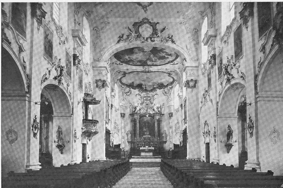
OBEN: INNEN-ANSICHT DER STIFTSKIRCHE IN ARLESHEIM BEI BASEL