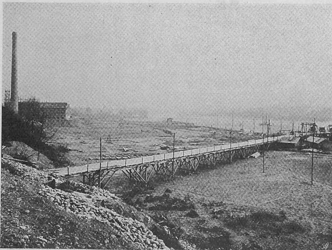
Abb. 80. Die Baustelle mit Dienstbrücke zum Stauwehr (I. XII. 08).

Badischen Staatsbahn durchgeführt ist, wurde als Zufahrtssträsschen ausgebaut; zur Versorgung der Baustelle mit Licht und Kraft wurde im Herbst im Anschluss an das Rheinfelder Netz eine grössere Transformatorstation errichtet. Zur Beschaffung von Trinkwasser kaufte man im Spätherbst eine Quelle, die in einer Entfernung von rund 1,5 km am Fusse des Dinkelberges entspringt; die Quelfassung bestehend aus einer Brunnenstube und einem Reservoir von 50 m 3 Inhalt wurde der Bauunternehmung J. und W. Rapp in Basel zur Ausführung übertragen. Ende 1907 konnte die Wasserversorgung in Betrieb genommen werden.