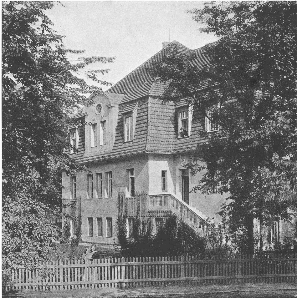
AERZTEWOHNHAUS DER ANSTALT BUCH BEI BERLIN