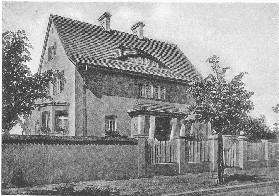
LANDHAUS IN DAHLEM BEI BERLIN