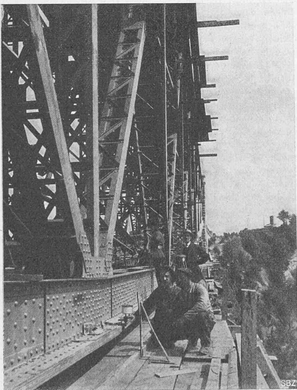
Abb. 59. Messung der Durchbiegung in Brückenmitte.

Den Schluss endlich bilde folgende Zusammenstellung über den Sitter-Viadukt der B. T.: