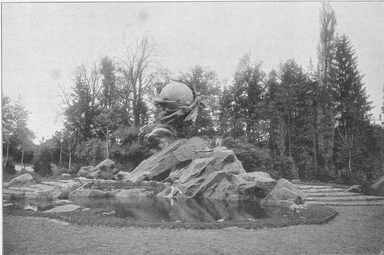
Ansicht des Denkmals von der Bundesgasse aus.

Zieht man auch hier die 7% nicht zu vermessendes Gebiet ab, so finden wir also 60% der Schweiz als gar nicht vermessen vor.