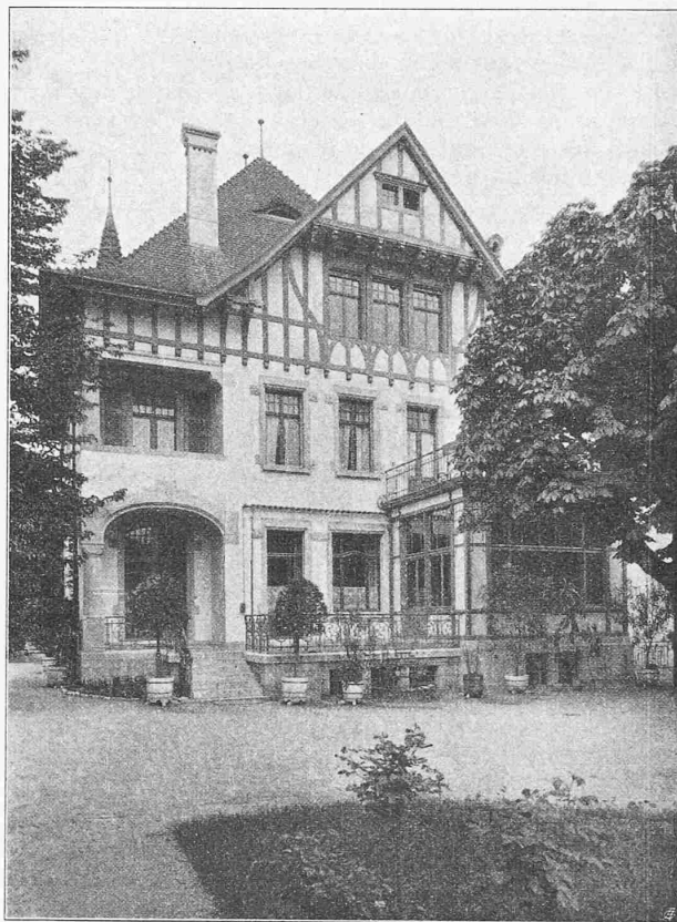
Abb. 3. Gartenfassade des Hauses Schützenmattstrasse 61.

Die durchaus neue Gartenanlage wurde dem alten Baumbestand angepasst. Ausser diesem ist als letzter