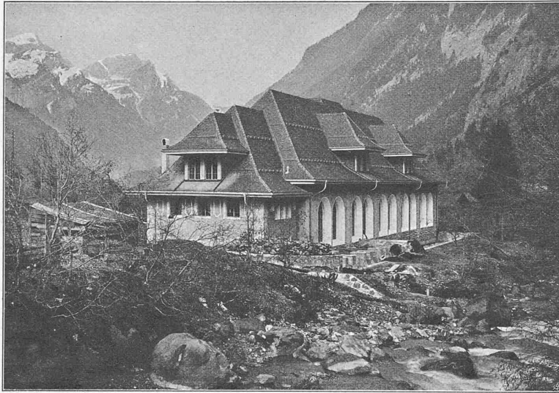
Abb. 21. Das Maschinenhaus vom rechten Ufer der Lüttschine aus. Entworfen von Haller & Schindler, Architekten in Zürich.

Das Maschinenhaus, mit einer Länge von 55,00 und einer Breite von 15,0 m, hat gegen Burglauenen hin einen 7,50 m breiten und 13,0 m langen Anbau für Werkstätte und Bureau und einen, gegen Süden bzw. auf der Bergseite gelegenen, weitem Anbau von 19,50 m auf 7,80 m für die Transformatoren und die Schaltanlage erhalten (Abbildung 20, S. 268). Die Maschinenhalle von 53,4 m lichter Länge, 12,80 m Breite und 8,80 m Höhe ist für die Aufnahme von vier Gruppen zu 1250 PS, zwei Gruppen zu 2500 PS und zwei Erregergruppen erstellt. Unter den Turbinen liegt auf der ganzen Länge des Gebäudes der gewölbte Unterwasserkanal von 4 m Breite und 3,25 m