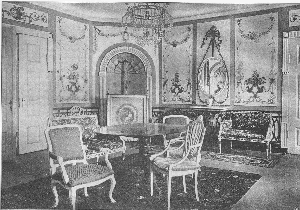
Abb. 4. Blick in den Gartensaal des Schlösschens Liselund auf Möen (vergl. Literatur Seite 56).