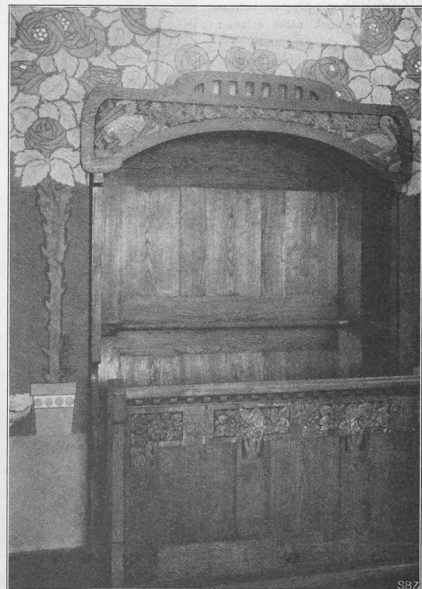
Abb. 13. Ansicht des dreisitzigen Chorstuhls.