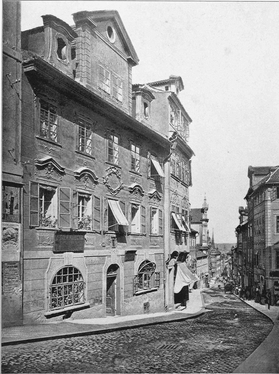
Strassenbild aus Prag.

Aus „Alt-Prager Architektur-Detaile“ von F. Kick.