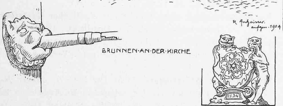
Brunnen an der Kirche zu Estavayer mit Details.

gemein auf die Gemeinden in künstlerischem Sinne einwirken und die Presse für die Aufgaben der Denkmalpflege interessiert werden. Prof. Dr. Clemen aus Bonn teilte mit, dass an der Bonner Universität seit mehreren Jahren mit bestem Erfolge Vorträge über den Wert der Denkmalpflege gehalten würden und wies auf die notwendige Mitwirkung der geistlichen Behörden gerade auf diesem Gebiete hin.