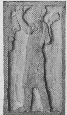
Abb. 22. Detail eines Emporenkapitäls.

wir auf einen seit dem 16. Januar 1905 durchgeführten Versuchsbetrieb auf der Teilstrecke Seebach-Affoltern zu verweisen. Dieser Versuchsbetrieb hat ergeben, dass hohe Spannungen vollständig betriebssicher verwendbar sind und dass es möglich ist, wie wir an der Frankfurter elektrischen Ausstellung nachgewiesen haben und wie es seither in der Kraftübertragungstechnik geschieht, die mit solch hohen Stromspannungen erreichbare Wirtschaftlichkeit auch bei den Fahrdrathleitungen von Bahnen auszunützen. Die Verlängerung Affoltern-Regensdorf befindet sich in Ausführung und wurde nur deshalb nicht früher in Angriff genommen, weil erst Gewissheit darüber erlangt werden musste, ob die der ganzen Strecke entlang gehenden interurbanen Telefonstränge nicht gestört, und ob die mit der Verlegung dieser Stränge verbundenen Kosten vermieden werden können, was nunmehr der Fall ist. Wir hoffen nun in kürzester Zeit zum Abschluss unserer Versuchsanlage zu kommen. Wir bedauern nur, dass mit der Einführung des elektrischen Betriebes im Simplontunnel nicht zugewartet werden konnte, bis die Resultate der Versuche,