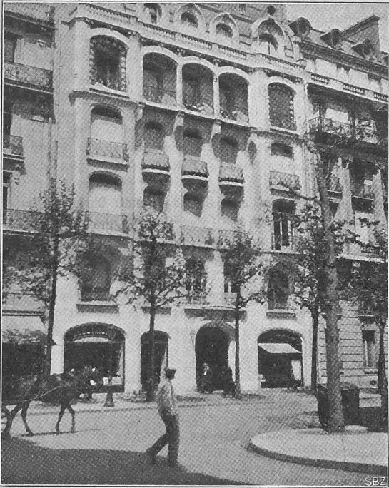
Abb. 5. Haus von Arch. Ch. Plumet, Avenue Victor Hugo Nr. 50.

Ein weiteres Merkmal des Fortschrittes bildet die Zunahme der Verwendung von Eisenbahnschienen aus Flusstahl, begünstigt durch den Aufschwung der amerikanischen Bessemer- und Siemens-Martin-Flusseisenerzeugung und das Sinken der Eisenpreise. Im Jahre 1878 war nur ein ganz kleiner Teil des Eisenbahnnetzes mit Flusseisenschienen ausgerüstet, deren Marktpreis 223 Fr. für die Tonne betrug. Heute sind die Flusseisenschienen fast überall im Gebrauch und ihr Preis beträgt nicht mehr als Fr. 147,50 für die Tonne. Weitere Verbesserungen des Eisenbahnoberbaues in diesem Zeitabschnitt sind: die Verminderung der Schwellenabstände, die Verbesserung der Weichen und Herzstücke und der Ersatz der alten hölzernen durch eiserne Eisenbahnbrücken.