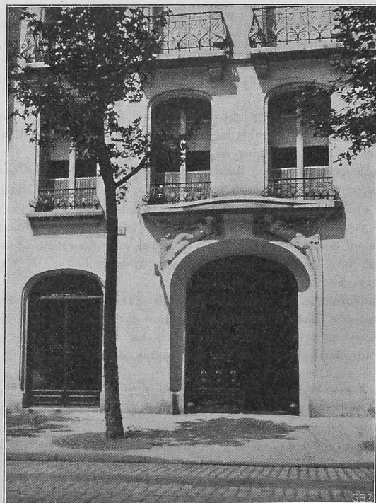
Abb. 6. Portal des Hauses Nr. 50 in der Avenue Victor Hugo.

1) Vergl. unsere Nummer vom 15. Juli d. J.