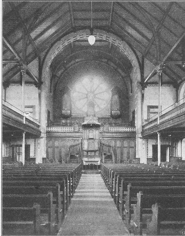
Fig. 4. Vue de l'intérieur.