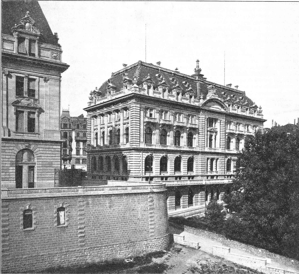
Fig. 1. Banque cantonale vaudoise. — Architecte: Francis Isoz . — Façade sud.

La Banque cantonale et l'hôtel des Postes sont placés l'un à côté de l'autre derrière l'église Saint François et au bord du plateau dominant le versant de Lausanne du côté du lac, ils forment un groupe imposant et tout à fait monumental.