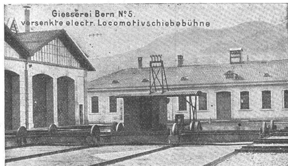
Giesserei Bern N o 5. versenkte electr. Locomotivschiebebühne

Hebezeuge jeder Art als: Laufkräne , und feste od. fahrbare elektrischen Betrieb; Drehkräne für Hand- und speziell elektrischen , und Aufzüge für hydraulischen, elektrischen , und Transmissionsbetrieb .