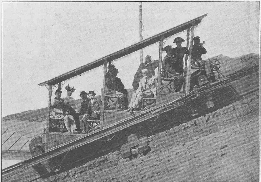
Abb. 2. Personenwagen der alten Vesuv-Seilbahn.

Der Wagen gelangt bald in die Via di Chiaja,