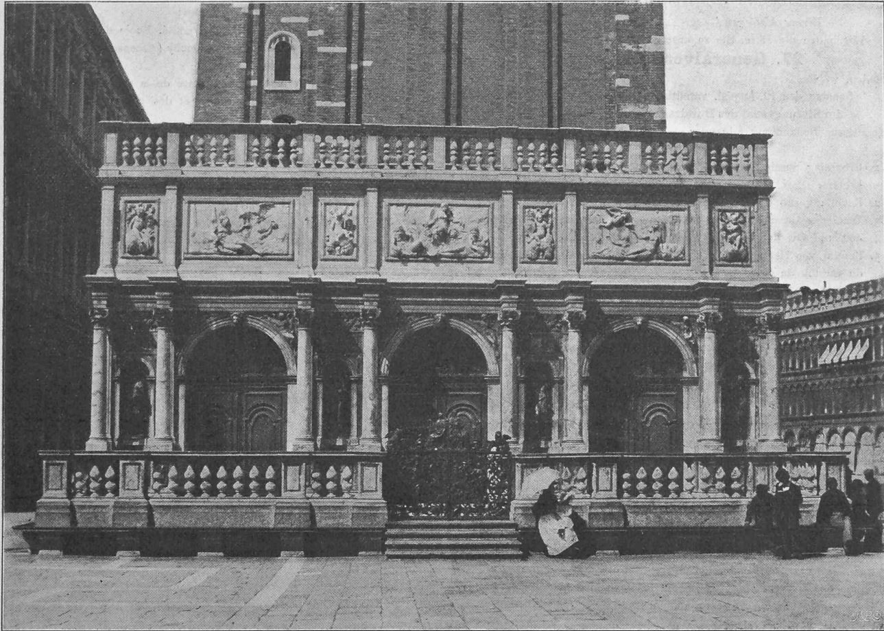
Die Loggetta des J. Sansovino am Fusse des Turmes von San Marco.

Zum Einsturz des Turmes von San Marco zu Venedig.