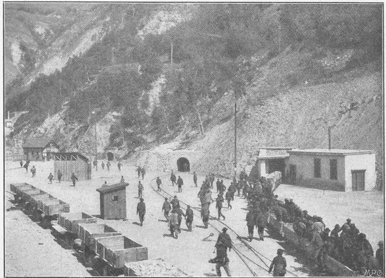
Abb. 46. Mündungen von Richtstollen, Tunnel I und Tunnel II (Nordseite) mit Arbeiterzug aus Tunnel II kommend. (Sommer 1900.)

Unterbauarbeiten bereits ausgeführt worden, womit wir uns aber nicht weiter befassen; es genüge die Bemerkung, dass sich diese Anlagen östlich vom jetzigen Bahnhof in einer Länge von etwa 1 km der Rhone entlang erstrecken werden und dass das ganze Bahnhofplanum mit dem Ausbruchmaterial des Tunnels angeschüttet werden soll. — Eine Ansicht der Fundament- und Unterbauten der neuen Lokomotivremise ist in Abb. 42 gegeben. — Diese Bahnbauten