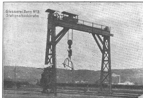
Giesserei Bern N o 3 Stationsbockkran

Hebezeuge jeder Art als: Laufkrane , und feste od. fahrbare elektrischen Betrieb ; Drehkrane für Hand- und speciell elektrischen Betrieb; Aufzüge für hydraulischen und elek- trischen Transmissionsbetrieb.