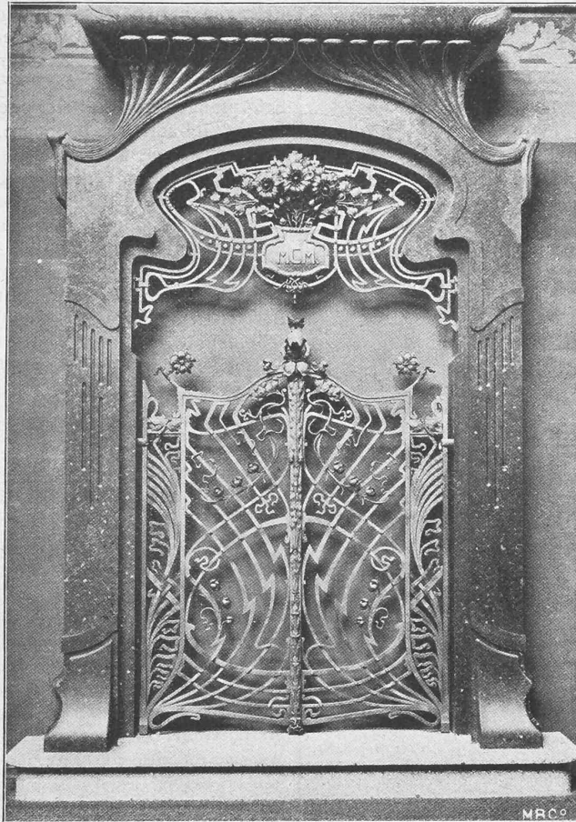
Fig. 1.- Schmiedeiserne Thüre von A. Kühnscherf & Söhne in Dresden. Entworfen von Prof. Weisse in Dresden.