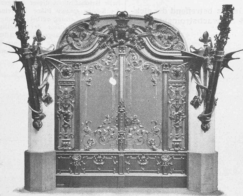
Fig. 2. Schmiedeisernes Portal von Hermann Fritzsche in Leipzig.