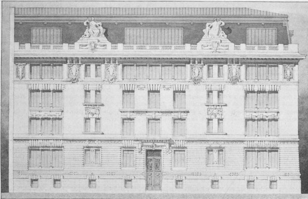
Hauptfassade der Kunstschule. — 1 : 300.

II, Preis. Entwurf von Franz & Leo Fulpius , Architekten in Genf.