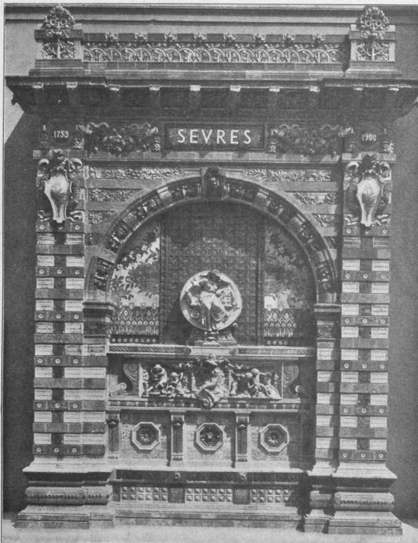
Fig. 35. Fayence-Portal in der Sèvres-Ausstellung.

Architekt: Ch. Risler, Bildbauer: J. Coutan.