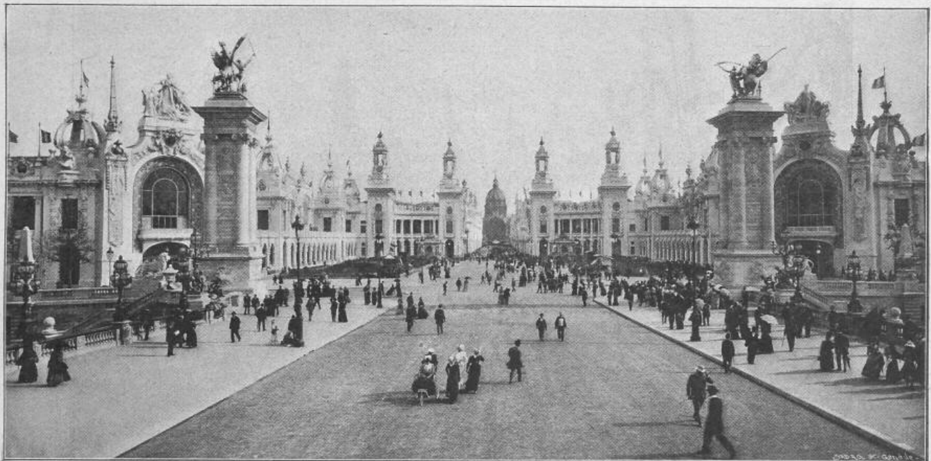
Fig. 31. Invaliden-Esplanade, von der Alexander-Brücke aus gesehen.

in Paris. Polytechnikum in Pittsburg (V. St.) — Konkurrenzen: Neubau eines Knabensekundarschulhauses in Bern. Central-Museum in Genf. — Preisausschreiben: Preisausschreiben des Vereins für Eisenbahnkunde zu Berlin. — Nekrologie: † H. V. von Segesser. — Vereinsnachrichten: Zürcher Ingenieur- und Architekten-Verein. Gesellschaft ehemaliger Studierender: Stellenvermittlung.