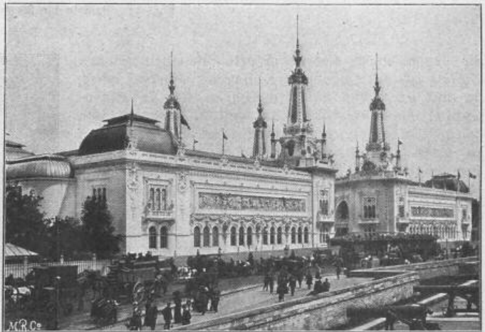
Fig. 34. Palast für Dekoration und Mobiliar. — Hinterfassade.