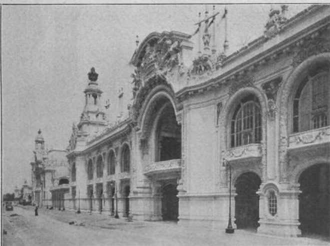
Fig. 33. Palast für verschiedene Industrien.

Diese Anlage bildet eine Art Forum von theatralischer Pracht. Die Fortsetzung der Strasse von dem Forum bis zum Schluss an der Avenue de la Motte Piquet zeigt