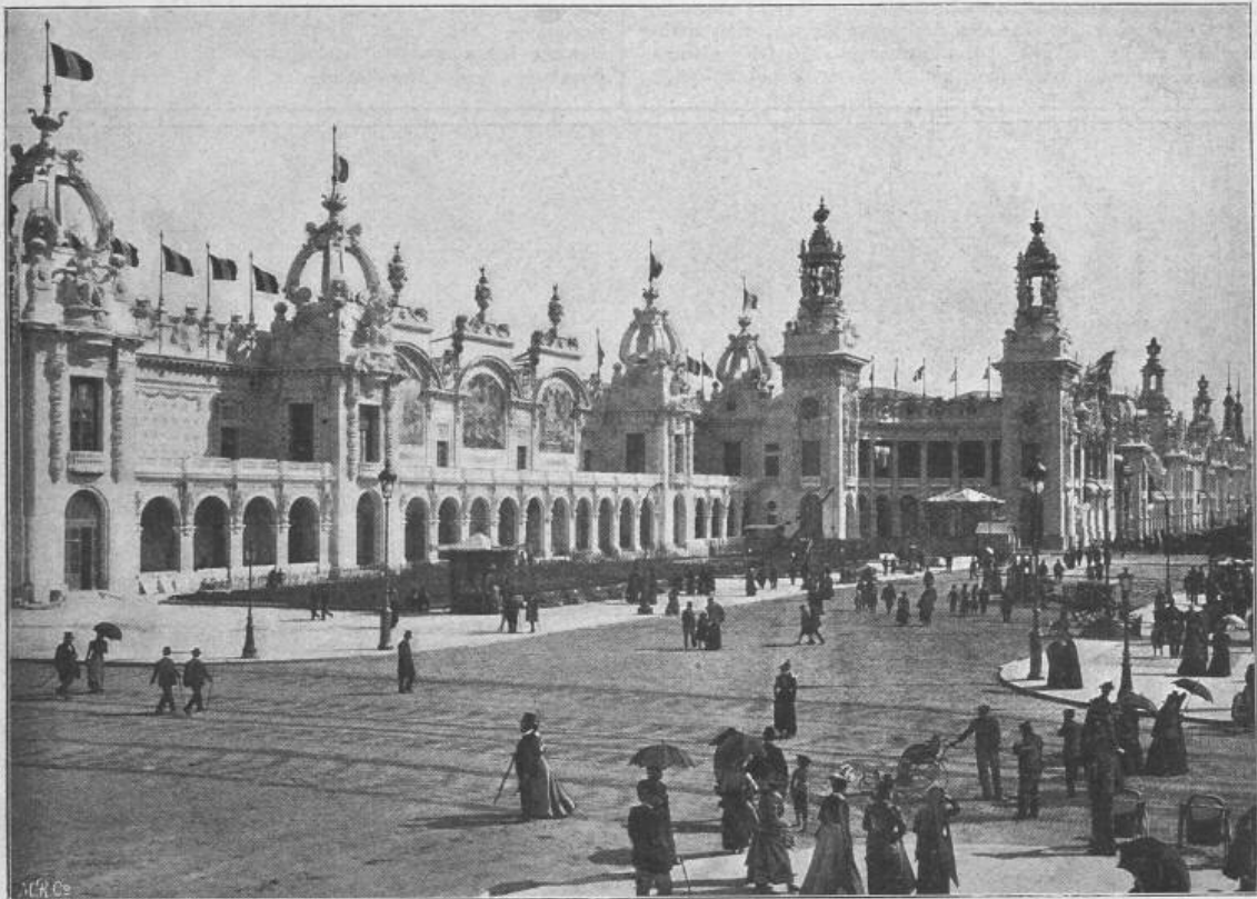
Fig. 32. Paläste für Staatsmanufaktur. Linke Seite. Architekten: Toudoire und Pradelle .

Sie legen sonst weniger Wert auf einen reichen Umriss als ihre deutsche Kollegen; diesmal aber, da mit Rücksicht auf den Umriss der Invaliden-Kuppel eine weise Zurückhaltung am Platz gewesen wäre, thaten sie des guten zu viel und verfehlten so ihren Zweck. Die vielen Aufbauten: grosse Figurengruppen, durchbrochene Kuppeln, kolossale Vasen, von Kariatiden oder von Säulen getragene Glorietten, Giebel und spitzige Türme sind teilweise an und für sich von unschöner Form und wirken in der Gesamt-Erscheinung furchtbar unruhig.