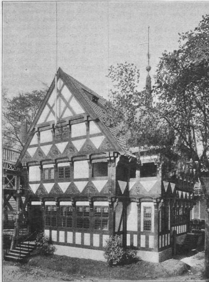
Fig. 26. Der dänische Pavillon.