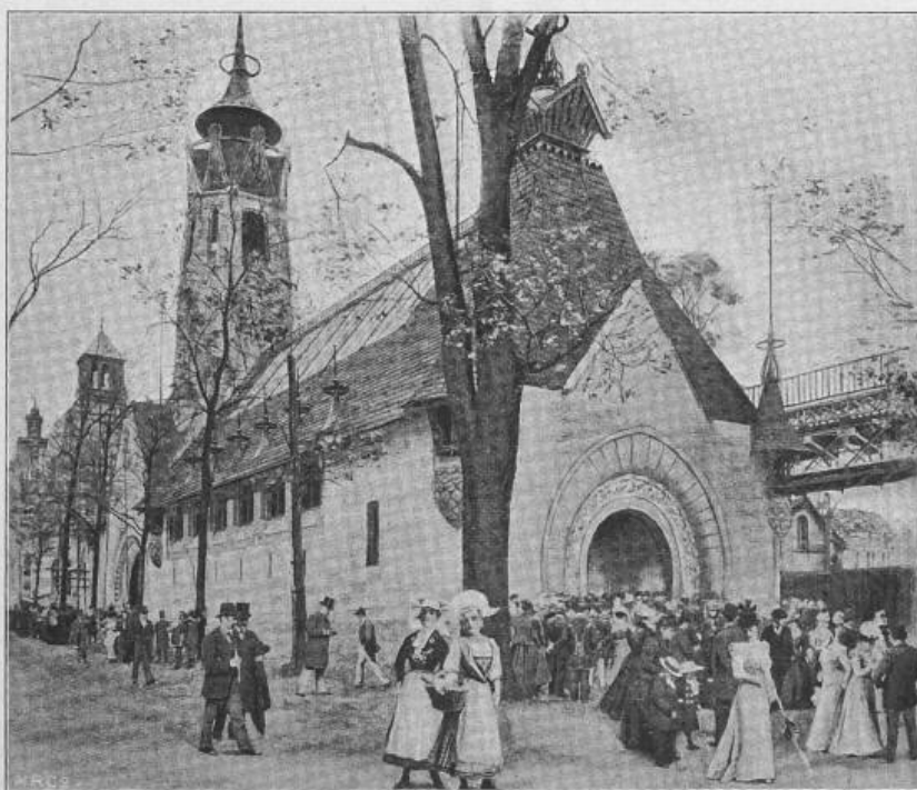
Fig. 27. Der finnländische Pavillon.