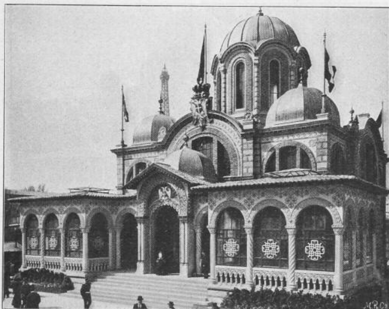
Fig. 25. Der serbische Pavillon.