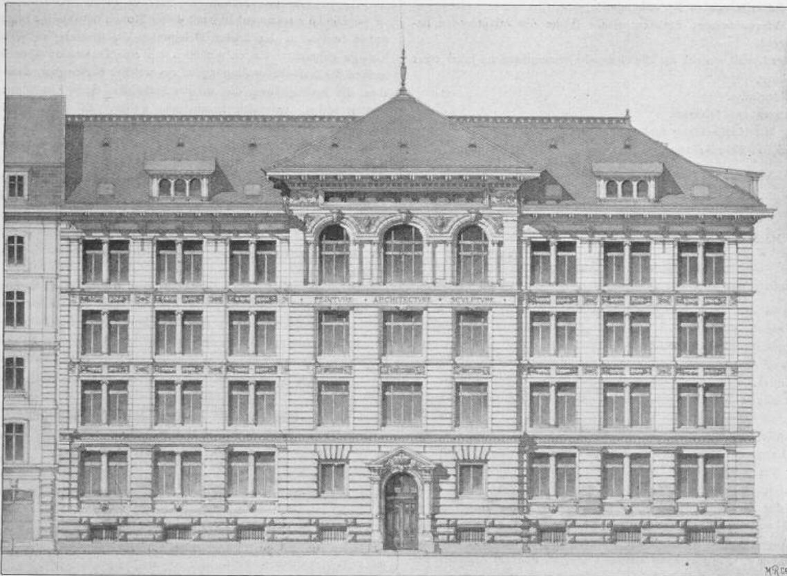
Hauptfassade der Kunstschule. 1 : 300.