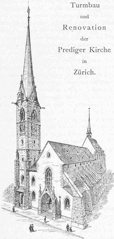
Turmbau und Renovation der Prediger Kirche in Zürich.

front zu stehen; er misst 7 m im Geviert und erhält eine Höhe von 43 m vom Boden bis zu den Wasserspeiern und 40 m von da bis zur Helmspitze, somit beträgt die ganze Höhe 83 m, also nur unbedeutend weniger als diejenige des Fraumünsterturmes, welcher eine Höhe von etwa 90 m erreicht.